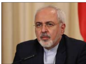
گروه سیاسی: سخنگوی کمیسیون امنیت ملی و سیاست خارجی مجلس گفت: در جلسه یکشنبه این

کمیسیون وزیر خارجه توضیح داد که از مدت ها قبل از خروج آمریکا از برجام مکاتباتی با سایر طرف ها در خصوص نقض تعهدات از سوی آمریکا صورت گرفته است.