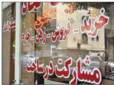
به شرایط متعادل برسانند.