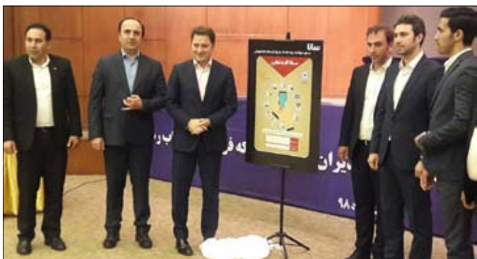
کارت تعاون "گفت: آینده صنعت بیمه در اختیار اینشتور تک هاست و هر شرکتی ارتباط قوی تری با اینشتور تک‌ها داشته باشد، در آینده موفق تر خواهد بود. وی افزود: یکی از دلایلی