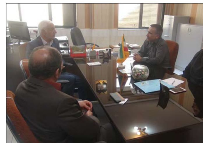
موزه آب و فاضلاب استان اصفهان باید با نگاه ملی و در شان پایتخت فرهنگی جهان اسلام ایجاد شود.

تجارت-استان اردبیل: مدیرعامل شرکت توزیع نیروی برق استان اردبیل با اشاره به طرح‌های تشویقی وزارت نیرو برای کاهش میزان مصرف برق بخش خانگی در ایام پیک مصرف تابستان گفت: در صورت صرفه‌جویی