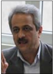
عضو هیئت‌مدیره اتحادیه مرغداران گوشتی از ثبات نرخ مرغ در بازار خبر داد و گفت: متوسط نرخ هر کیلو مرغ زنده ۹ هزار و ۵۰۰ تا ۱۰ هزار و مرغ آماده به طبخ در خرده‌فروشی‌ها ۱۳ هزار و ۷۰۰ تا۱۴ هزار و ۲۰۰ تومان است.عظیم حجت در گفت و گو با باشگاه