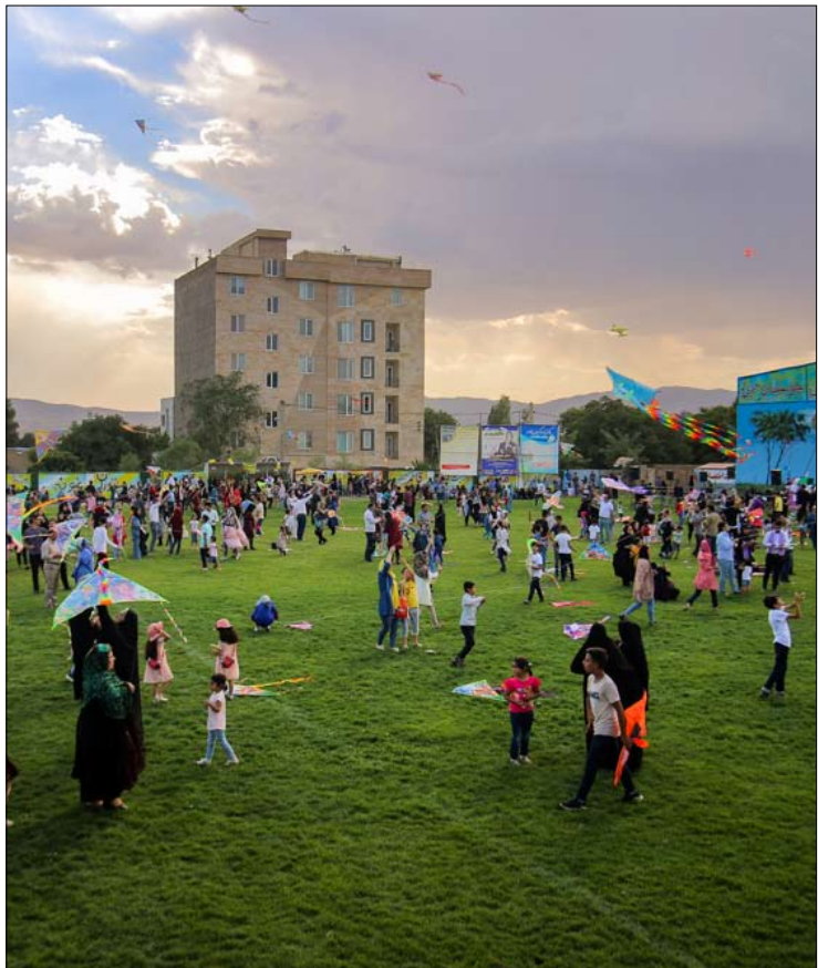
قاب روز جشنواره بادبادک ها / زنجان

نمی‌تواند از آن رویداد برای تهدید و ارباب پکن استفاده کند. چین حالا قوی‌تر شده است." واقع‌ه‌ها حال هنرمند چینی مخالف دولت پکن نگرانی خود را بابت تکرار واقعه میدان تیان آن من در هنگ کنگ ابراز داشت. آی‌وی، هنرمند معاصر چینی مخالف دولت پکن در مصاحبه‌ای گفت: فکر نمی‌کنم هرگونه پیش‌بینی در این باره خیلی سخت باشد. چین جامعه‌ای است که برای حفظ کنترل خودش هر چیزی را قربانی می‌کند. در ۱۹۸۹، تمام جهان ناظر بودند و تانک‌ها، دانشجویان را در یک راهپیمایی صلح آمیز زیر گر گرفتند. این هشدار از سوی این هنرمند پس از دو ماه اعتراضات مطرح شده که هنگ کنگ را به شدت دچار مشکل کرده است. اگرچه بسیاری از تحلیلگران می‌گویند بعید است که چین به یک سرکوب تمام عیار علیه معترضان در این دولت‌شهر دست بزند. این هنرمند مخالف دولت چین می‌گوید: در آغاز این اعتراضات یعنی دو ماه قبل، من هشدار داده بودم که دولت پکن در نهایت و در صورتی که نتواند این اعتراضات را متوقف کند، از خشونت استفاده می‌کند. راه دیگری وجود ندارد. آنها نمی‌توانند درباره این اوضاع گفتگو یا مذاکره