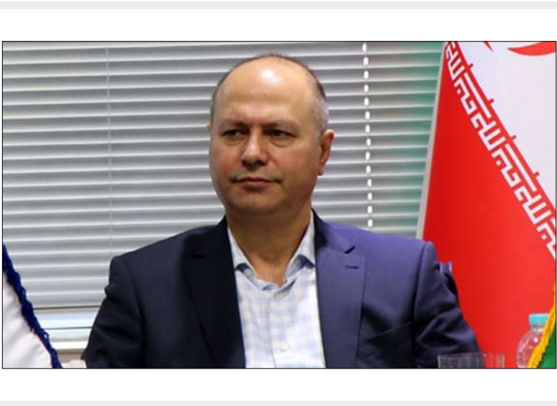
نایب‌رئیس کمیسیون فولاد اتاق بازرگانی، در نشست کمیسیون فولاد اتاق بازرگانی، تهران.

دخالت در نظام بازار بر دارد و بگذارد عرضه و تقاضا قیمت‌ها را مشخص کند. اگر از این بابت نگرانی دارد، بگذارد تشکلهای مسئولیت را بر عهده بگیرند اما خودش به هیچ عنوان دخالت نکند. هر چند ما معتقدیم که تشکلهای هم هیچ دخالتی نباید داشته باشند. البته ما منکر نظارت نهادهای مسئول نیستیم و انتظار داریم آنها با هر گونه تخلف برخورد کنند اما نمی‌توان به صرف تخلف یک نفر کل صنعت را مجازات کرد. ■ صادرات فولاد را آزاد کنید