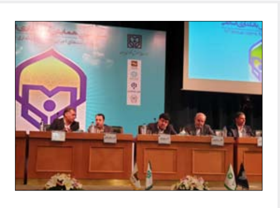
رئیس هیات مدیره بانک توسعه صادرات تواناد از موکات پیشگیری کند.

سپرده پذیر، نگاه، منسوخ خواندو گفت در نظام بانکی دنیا اعتبارسنجی جای وثیقه را گرفته است چرا که با کلان شدن مطالبات دیگر وثیقه پاسخگو نیست و به جای آن اعتبار مشتری اهمیت پیدا می کند.