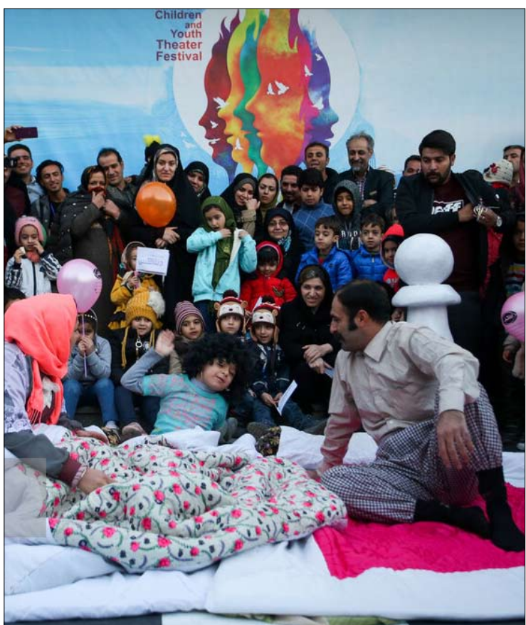
نمایش خیابانی / جشنواره بین المللی تئاتر کودک و نوجوان / تهران