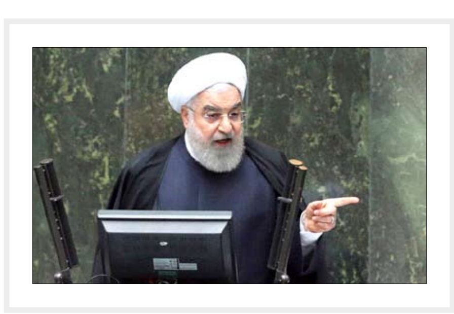
رئیس‌جمهور در تشریح ویژگی‌های لایحه دخل و خرج دولت در سال ۹۹ تاکید کرد؛

آسمانی آمار برداشت محصولات کشاورزی در خوزستان بسیار خوشحال‌کننده است و خوشبختانه در همه محصولات کشاوری نسبت به سال گذشته شاهد رشد قابل ملاحظه ای هستیم.