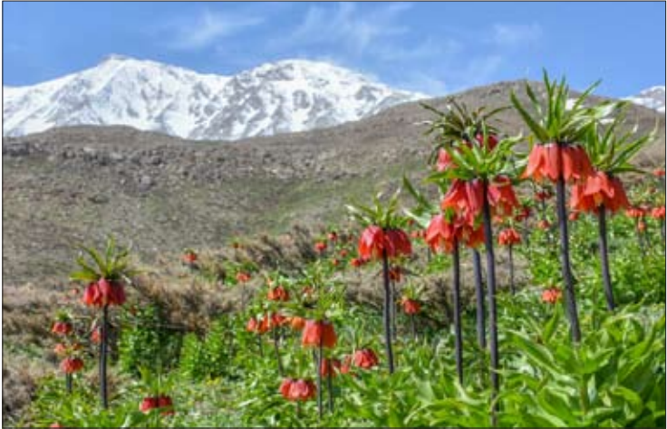
قالب روز دشت لاله واژگون/ مهر