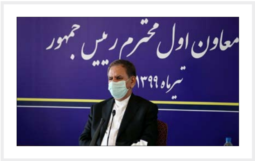
معاون اول رییس‌جمهور

جهانگیری با بیان اینکه چین دومین اقتصاد بزرگ دنیا است، گفت: باید با شهامت از توسعه روابط راهبردی کشورمان با پکن دفاع کنیم.وزارت خارجه می‌تواند در حوزه‌های مختلف از انرژی تا فناوری روی این تقاهم نامه کار کند. معاون اول رییس‌جمهور ادامه داد: هند هم کشور بزرگی است و باید با دقت بیشتری بر مناسبات اقتصادی با این کشور متمرکز شد. وزارت امور خارجه باید برای توسعه روابط اقتصادی با کشورهای هدف برنامه‌ریزی ویژه‌ای انجام دهد و اگر لازم باشد برای تقویت کادر نمایندگی ایران در این کشورها تصمیمات جدی بگیرد. وی با اشاره به آثار مثبت اجرای سیاست‌های اقتصاد مقاومتی در تاب آوری کشور مقابل تحریم‌ها نظیر رفع نیازهای کشور به فرآورده های نفتی و کالاهای اساسی نظیر بنزین و گندم، گفت: باید اقتصاد کشور به مردم سپرده شود و مردم میدان دار اقتصاد باشند. باید با شهامت از بخش خصوصی که سالم کاری کند و سربازان خط مقدم جنگ اقتصادی هستند، دفاع و حمایت کنیم. معاون اول رییس‌جمهور یکی از اصلی‌ترین رویکردهای