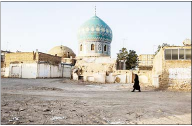
قازون / رها شدن نوسازی بافت فرسوده قم / مهر

آیین نامه اخلاق حرفه‌ای «تجارت» را در سایت روزنامه ببینید.