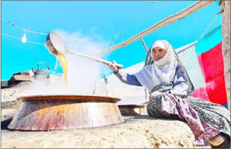
قالب روز تولید شیره انگور - سبزووار امیزان

مدیر ارشد اجرایی تسلا از ارائه نسخه آزمایشی قابلیت «کاملاً خودران» برای تعدادی از مشتریان خبر داده است. با کمک این قابلیت تغییر لاین خودکار برای کاربران فراهم می‌شود. به گزارش مهر به نقل از دیلی میل، الون ماسک مدیر ارشد اجرایی تسلا در یک توییت اعلام کرد نسخه بتا قابلیت «تمام خودران» به طور محدود برای برخی از مشتریان ارائه می‌شود که رانندگان با دقت و خبره‌ای تلقی می‌شوند. این به روزرسانی ۱۰ اکتبر (هفته آینده) ارائه می‌شود. دسترس به ویژگی‌های مخصوصی برای رانندگی در بزرگراه و کنترل علائم راهنمایی و رانندگی و تابلوی ایست و برای راننده فراهم می‌کند. نرم‌افزار مذکور نسخه پیشرفته «توپاویلت» است و این بدان معناست که رانندگان باید هنگام استفاده از این فناوری همچنان دست‌هایشان را روی