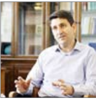
وزیر علم، فناوری و نوآوری