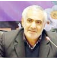
وزیر علم، فناوری و نوآوری