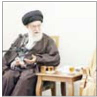
آیت‌الله محمد امامی کاشانی

حضرت آیت‌الله خامنه‌ای رهبر معظم انقلاب اسلامی درگذشت آیت‌الله آقای حاج شیخ محمد امامی کاشانی رحمت‌الله‌علیه را تسلیت گفتند. به گزارش تجارت، متن پیام رهبر انقلاب به این شرح است: