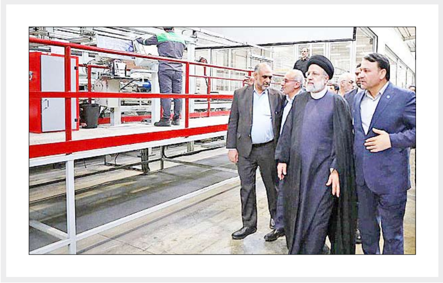
از بزرگترین تولیدکننده‌های انواع ورق‌های MDF و تئوپان، ملامنه است. این مجموعه در راستای تولید و ایجاد اشتغال و به منظور حفاظت ملامنه، پانل‌های هایگلاس، صفحات لب گرد و کاغذ آغشته

گروه بانک و بیمه: فاز اول مجتمع کشت و صنعت گروه صنعتی پاک چوب، به عنوان بزرگترین واحد تولید ورق‌های فشرده چوبی در غرب آسیا، با حضور رئیس‌جمهور افتتاح و به شکل رسمی مورد بهره‌برداری قرار گرفت. به گزارش تجارت به نقل از روابط عمومی، سیدابراهیم رئیسی به همراه جمعی از وزرا و آیت‌الله‌های مدیرعامل بانک سپه صبح روز جمعه در اولین بخش از برنامه‌های سفر به استان خوزستان با حضور در شهرستان شوش، فاز اول مجتمع کشت و صنعت گروه صنعتی پاک چوب را افتتاح کرد. فاز اول این مجتمع در مدت ۲ سال و با حمایت مالی بانک سپه و سرمایه ای معادل ۴۳ میلیون یورو اجرا شده و از ظرفیت تولید سالانه ۴۰۰ هزار مترمکعب بر خوردار است. رئیس‌جمهور در جریان این مراسم از بخش‌های مختلف کارخانه و مزرعه کشت چوب این واحد بازدید کرد و با توضیحات دست‌اندرکاران از جزئیات فعالیت‌های آن مطلع شد. با بهره‌برداری از این مجتمع حداقل هزار فرصت شغلی مستقیم و ۸ هزار فرصت شغلی غیرمستقیم ایجاد و ضمن تأمین مواد اولیه تولید انواع محصولات فشرده چوبی بدون آسیب و لطمه به محیط زیست، از منابع طبیعی نیز صیانت شده و باعث جلوگیری از خروج ارز برای واردات و ایجاد رونق اقتصادی در منطقه خواهد شد. گروه صنعتی پاک چوب یکی