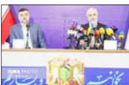
نمایشگاه کتاب باروند سابق در معرض تعطیلی بود

سوی و پنجمین دوره نمایشگاه بین‌المللی کتاب تهران با شعار «بخوانیم و بسازیم» از چهارشنبه، ۱۹ اردیبهشت آغاز می‌شود و تا پایان روز شنبه، ۲۹ اردیبهشت در مصلی تهران ادامه خواهد داشت. او افزود: نمایشگاه کتاب بزرگترین اجتماعی مردمی، محور دانش، آگاهی و کتاب است که با هم نهادهای مختلف بر گزار می‌شود. امیدواریم رویداد با حضور مشتاقانه ناشران خودمان در دو