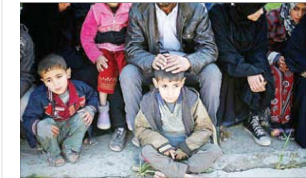
خانواده های عراقی فرار کرده از درگیربهای موصل

او گفت: ما قصد نداشتیم چنین کاری انجام دهیم اما انجام این کار لازم بود. هنوز مشخص نیست که چه تعداد از اتباع مالزی در گیر این ممنوعیت شده‌اند.