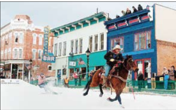
اسکی با اسب در کلورادو آمریکا