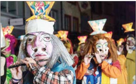
کارناوال بازل سوئیس