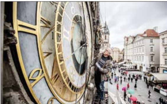
تعمیر قدیمی ترین ساعت شهر براف