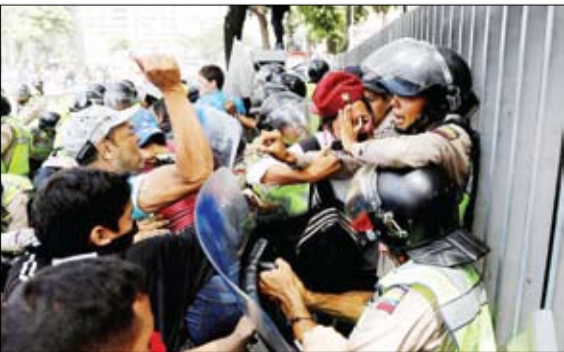
درگیری تظاهرکنندگان ونزوئلائی با نیروهای امنیتی

یک فرمانده میدانی ارتش سوریه اعلام کرد، افراد مسلح داعش هم‌زمان با حمله موشکی آمریکا به فرودگاه الشعیرات، حمله‌ای را به یکی از پست‌های ارتش سوریه که مسئولیت حفاظت از مسیر حمص – القریلس در تدمر را بر عهده دارد، در تادیب‌اندن این فرمانده میدانی در مصاحبه با اسپوتنیک گفت. آقا هم‌زمان شن حمله داعش به یکی از ایست‌های حفاظتی از مسیر حمص – تدمر با حمله آمریکا به فرودگاه الشعیرات یک امر تصادفی است؟گویی گفت: حدود دو ساعت حملاتی به این ایست بازرسی صورت گرفت و افراد مسلح داعش به مدت یک ساعت این مرکز را تحت کنترل داشتند. اما از تنش پس از آمدن تجهیزات توانست مجددا این مرکز را آزاد کند.