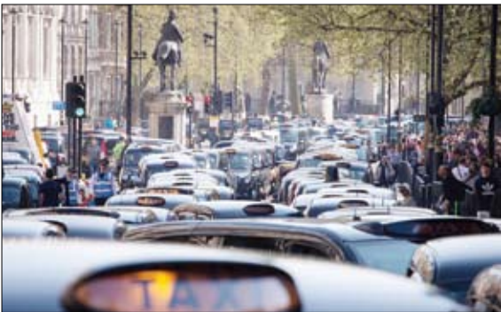
اعتصاب تاکسی‌های لندن به برنامه‌های دولت در بخش حمل و نقل