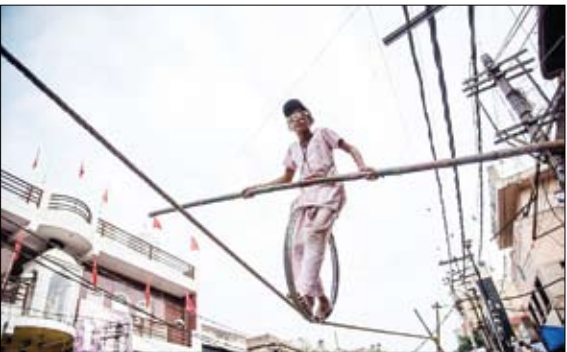
بندبازی دختر هندی در دهلی