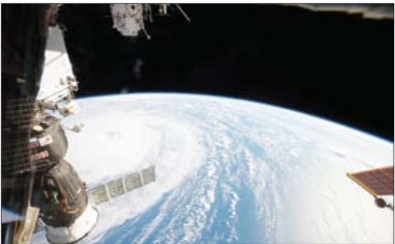
تصویری از کره زمین از کاوشگر ناسا