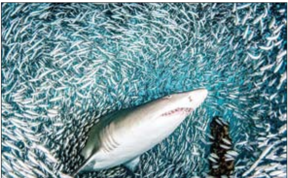
عور کوسه از میان هزاران ماهی