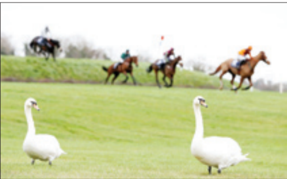
قوها در زمین اسب سواری فستیوال تاندر استیجلیس انگلیس – تلگراف

رفته‌است. در این گزارش ضمن بررسی چشم‌انداز اقتصادی کشورهای اروپایی؛ تدابیر اقتصادی کشورهای مذکور از جمله ترکیه، آمده است؛ با توجه به تکانه رشد قدرتمند ترکیه در سال ۲۰۱۷ باید در میزان حمایت از سیاست‌های مالی بازنگری و طرح دقیقتری برای تثبیت میان‌دوره‌ای رسمی دیون تنظیم شود. براساس پیش‌بینی صندوق بین‌المللی پول، نرخ رشد اقتصادی ترکیه در سال ۲۰۱۸ با توجه به سیاست‌های پولی و کاهش حمایت‌های مالی، ۵/۳ درصد اعلام می‌شود. در عین حال با وجود تنش درباره نرخ بهره بانکی در ترکیه چشم‌انداز اقتصاد ترکیه بهبود یافته است. موسسه بین‌المللی اعتبار سنجی استاندارد اند پورز (S&P) طی بیانیه‌ای با اشاره به افزایش بیش از ۱۰ درصدی میزان صادرات ترکیه در نیمه نخست اسمال پیش‌بینی کرده که اقتصاد ترکیه اسمسال ۵ درصد رشد خواهد داشت. این موسسه رتبه اعتباری‌وامی ترکیه را از نظر پول خارجی در سطح BB و پول داخلی BB+ تایید و چشم‌انداز فرآیند اقتصادی ترکیه را "منفی" اعلام کرد. در این بیانیه‌امده که صادرات ترکیه در هر زمینه‌ای افزایش یافته و بر میزان درآمد ناخالص ملی تاثیری مثبت داشته است. همچنین با اشاره به استفاده از جمعیت جوان