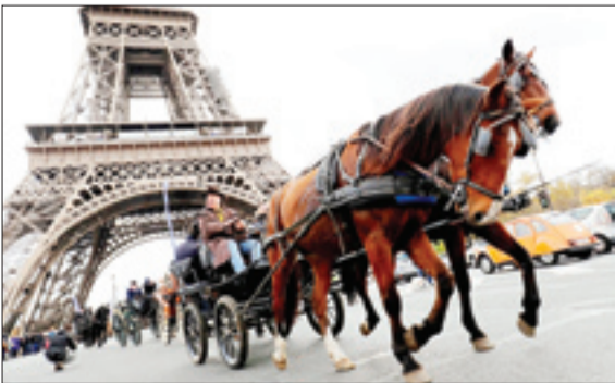
رژه اسب‌ها در خیابانهای پاریس – تلگراف