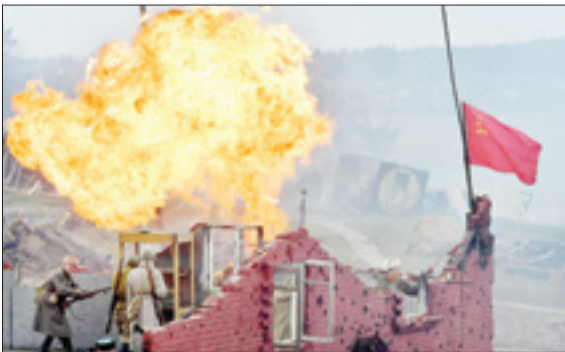
بازسازی جنگ استانبولگرد در جنگ جهانی دوم در روسیه – تلگراف