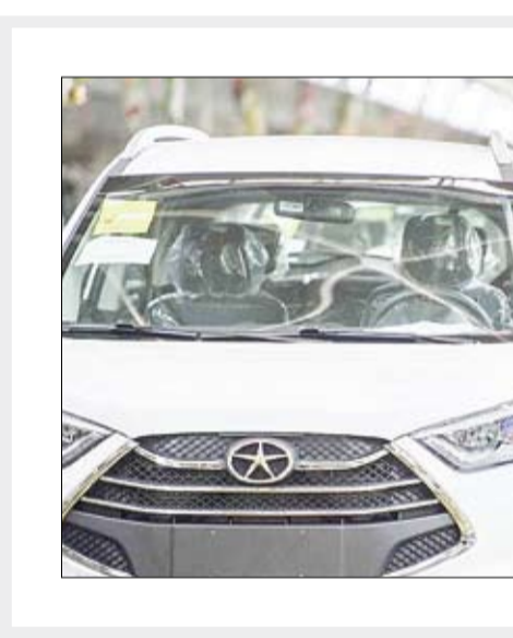
خودروهای تولیدی شرکت ستار لاین در نمایشگاه خودرویی تهران.