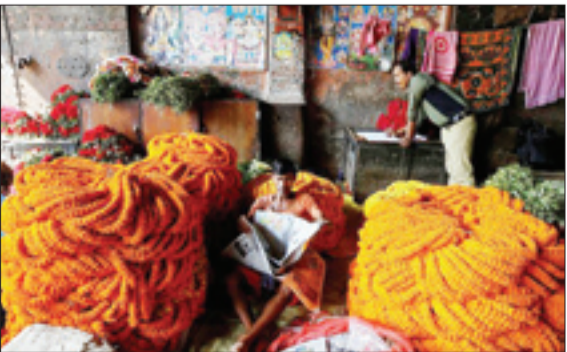
بازار گل در کلته هند - روترنژ

قبل از بروز بحران در لبنان، این کشور در مسیر خوب اقتصادی قرار گرفته بود. ماه گذشته بودجه لبنان تصویب شد و دولت برای رونق بخشیدن به اقتصاد برنامه‌هایی را در دستور کار خود قرار داده بود. استعفاي سعد حریری در عربستان سبب شد برنامه‌های یادشده متوقف شود. آینده مبهم سیاسی همچنین باعث عقب نشینی سرمایه‌گذاران شده است و لبنان به سرمایه‌ای خارجی نیاز مبرم دارد.