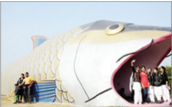
عکس سفلی در وودی اکرپوم شهر جامو و کشمیر