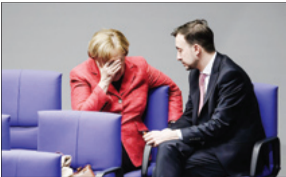
انگلا مرکل در کنار ریاست شاخه جوانان حزب دموکرات مسیحی در پارلمان آلمان