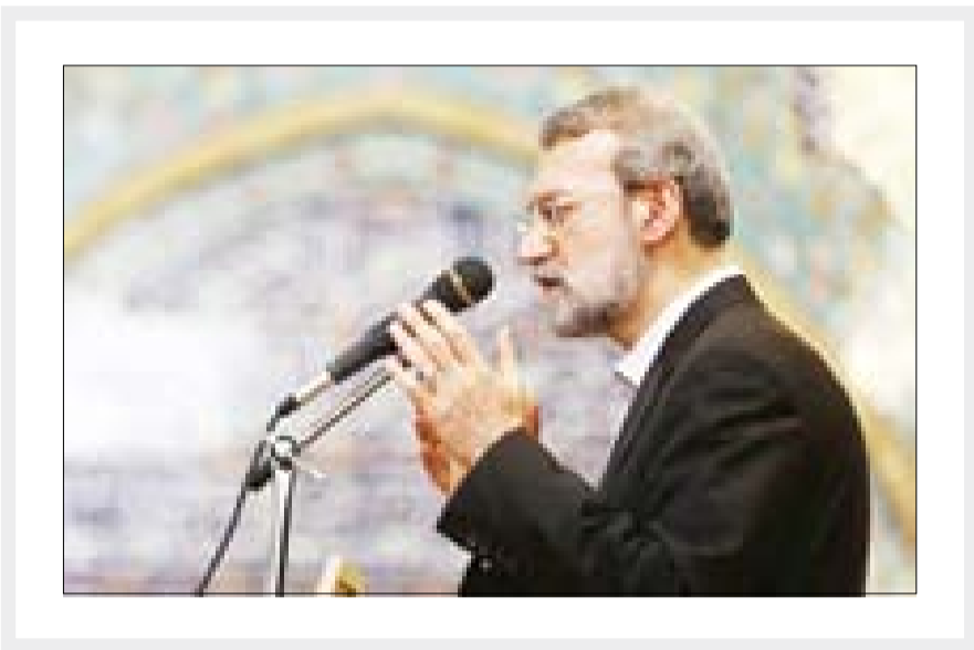
عنوان سندی مشخص در اختیار ایران است، شرط غنی سازی ایران را قبول کرد.

وی با اشاره به سخنان سخیف وزیر امور خارجه آمریکا در تعیین شرط و شروط برای ایران گفت: از ۱۲ موردی که وی در سخنان خود ایراد کرد، هفت مورد آن به مسائل منطقه‌ای و حضور ایران در عراق و سوریه مربوط می‌شود که این نشان از این واقعیت دارد که موضوع آمریکا با ایران سر مسئله