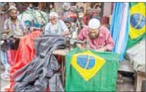
آماده کردن پرچم کشورهای حاضر در جام جهانی ۲۰۱۸ فوتبال در شهر داکا