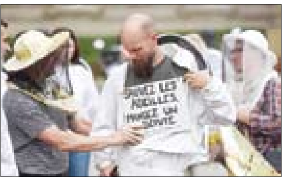
اعتراض زنبورداران در شهر استراسبورگ فرانسه