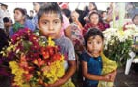
مراسم یادبود قربانیان آتشفشان هفته گذشته در گواتمالا

برای سرمایه‌گذاری در این صندوق داشتن کد بورسی الزامی است. پس از اخذ کد بورسی خرید یا فروش این صندوق‌ها امکان‌پذیر است؛ اما توصیه همیشگی ما برای سرمایه‌گذاران پرهیز از واکنش‌های هیجانی به نوسانات احتمالی در بازار است. ماهیت سرمایه‌گذاری ایجاب می‌کند که دیدگاه بلندمدت را مدنظر داشته باشند و به تیم‌های حرفه‌ای که مدیریت صندوق‌های سرمایه‌گذاری را بر عهده دارند اطمینان داشته باشند تا در نهایت از منافع آن بهره‌مند شوند.