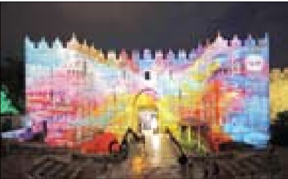
یک اثر هنری دیجیتال با پیام عشق و دوستی