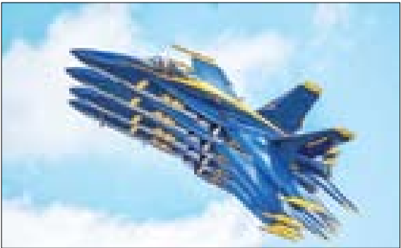
نمایش هوایی اسکادران آمریکایی در نمایشگاهدیتن در ایواوی آمریکا