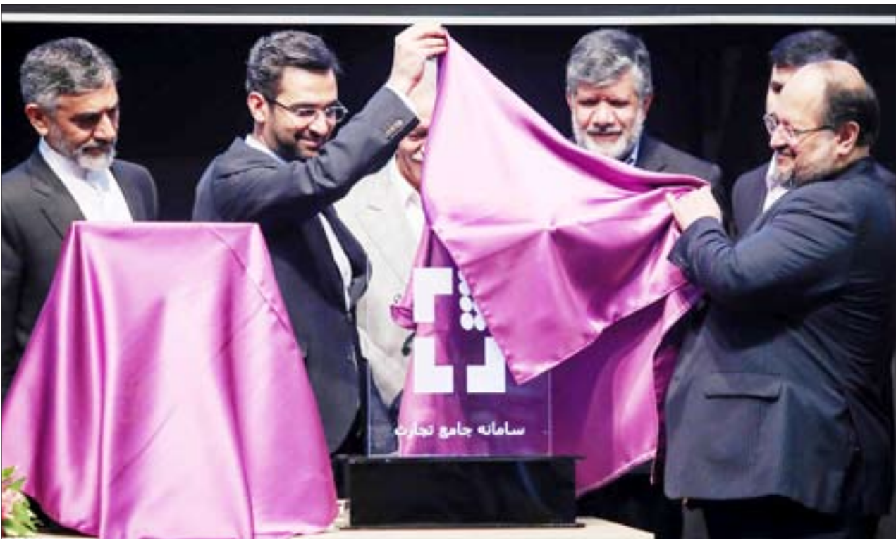
در مراسم رونمایی از سامانه جامع تجارت مطرح شد؛

گروه اقتصاد کلان - ایلیا پیرولی: در حالی که همه برنامه‌های مهار بحران ارزی در حال اجرای شدن است؛ کارشناسان اقتصادی این نوع سیاست‌گذاری‌ها را در راستای شوک درمانی در اقتصاد اعلام کرده و نسبت به تبعات آن هشدار دادند. شوک درمانی در اقتصاد معمولاً به اقداماتی مانند دست کشیدن دولت از کنترل قیمت‌ها، حذف یارانه‌ها و آزادسازی