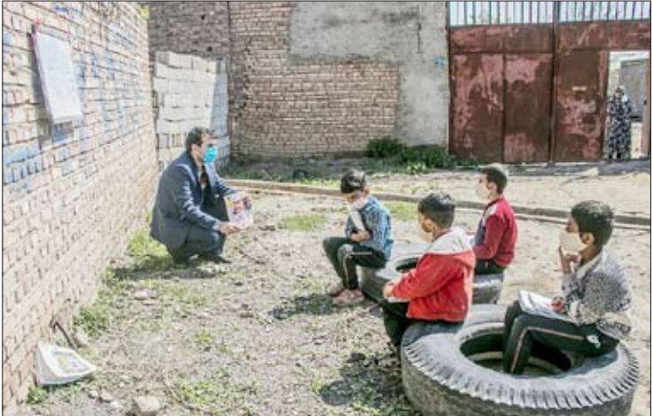
قاب روز / سرمشق اینار / مهر

و زیر کانه‌ای را برای غلبه بر سرطان کشف کرده‌اند. پژوهشگران در این پروژه، به بررسی «لنفوم غیرهاجکین» (NHL) پرداختند که شکل خطرناکی از سرطان است. لنفوم غیرهاجکین، در گره‌های لنفاوی آغاز می‌شود و به رشد غیر