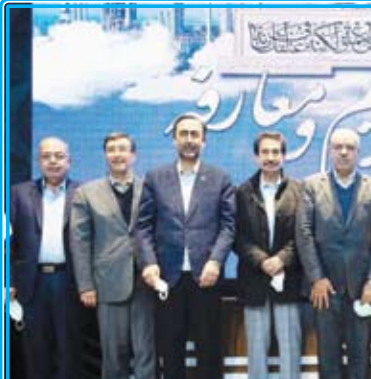
مدیران عامل صنایع پتروشیمی