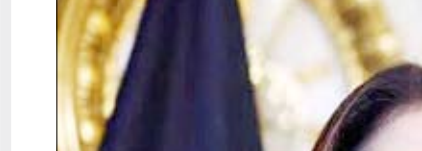
وزیر امور خارجه آلمان