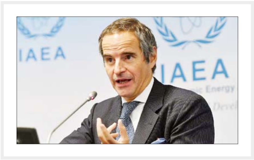
مدیرکل آژانس بین‌المللی انرژی اتمی افزود که ایران در حال حاضر ۷۰ کیلوگرم اورانیوم ۶۰ درصد غنی شده و هزار کیلوگرم اورانیوم با غنی ۲۰ درصد دارد. گروسی یک روز پیش از آن نیز مدعی شده بود که از برجام چیزی غیر از یک «پوسته خالی» نمانده است.

وی در یک نشست خبری مشترک با کمیته سیاست خارجی پارلمان اروپا، اعلام کرد که «توافق هسته‌ای ایران اکنون یک پوسته خالی است». گروسی، همچنین گفت که با این که هیچ کس برجام را «مرده» اعلام نکرده، «اما هیچ تهدیدی از آن دنبال نمی‌شود. ... همه حد و مرزهایی که در برجام وجود داشته، تاکنون چندین بار نقض شده است.» وی همچنین با اشاره به این که در ماه فوریه، به ایران سفر خواهد کرد، گفت: «فکر می‌کنم ممکن است در این مورد و به تهران بروم». گروسی در ادامه ابراز امیدواری کرد که شاید بعد از این سفر، «پیشرفت‌هایی» در این زمینه حاصل شود. اظهارات اخیر گروسی در شرایطی مطرح می‌شود که «محمد