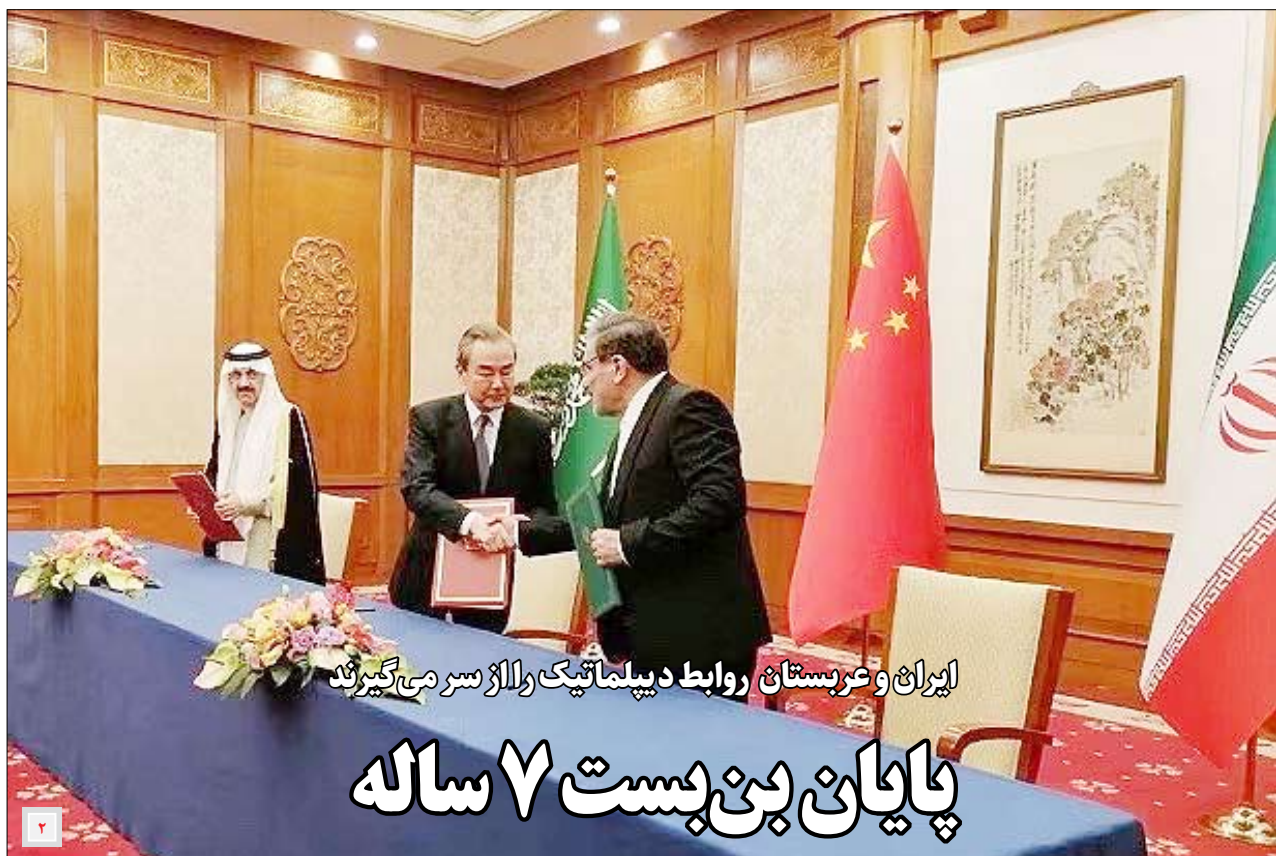
ایران و عربستان روابط دیپلماتیک و الاز سر می‌گیرند