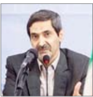
معاون وزیر صمت در مورد افزایش قیمت خودرو در سال آینده گفت: متوسط افزایش قیمت‌ها در سال آینده حدود ۳۰ تا ۷۰ درصد خواهد بود. منوچهر منطقی در خصوص وضعیت عرضه خودرو در بورس کالا، گفت: ابتدا عرضه خودرو در بورس از طریق مجلس منتفی شد و شورای رقابت هم حذف عرضه در بورس را اعلام کرد بنابراین فعلاً بحث عرضه خودرو در بورس مطرح نیست.

وی در مورد عرضه خارج از ضابطه خودرو توسط ایران خودرو نیز به ارائه توضیحاتی پرداخت و افزود: ایران خودرو هر ۳ یا ۴ سال به پرسنل خود خودرو می‌دهد اما در وضعیت فعلی که همه در صف هستند بهتر بود این موضوع را به تعویق می‌انداخت.