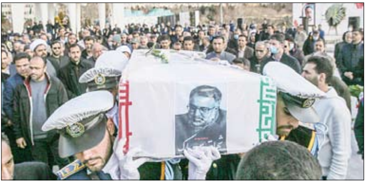
مراسم تشییع پیکر اسماعیل احمدی؛ مشاور وزیر ورزش