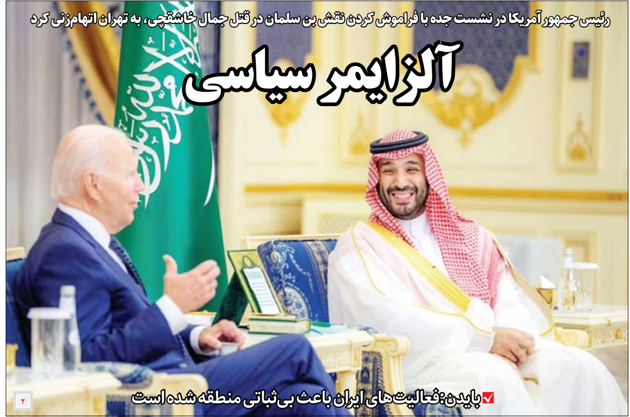
رئیس‌جمهور آمریکا در نشست جنده با فرمانروای عربی کرد، پیش از آنکه در گفتگو با خبرنگار اقتصادی، به تهرانی اتهام زنی کرد