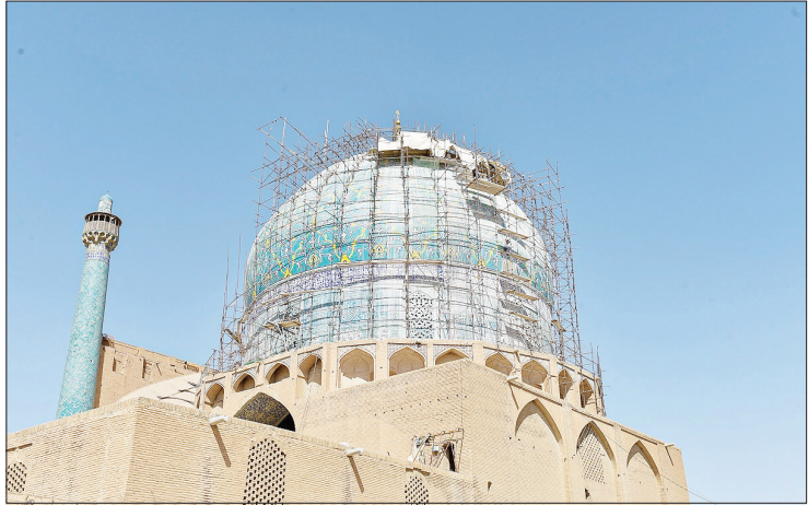
مرمت یا تخریب میراث فرهنگی؟ - اصفهان - باشگاه خبرنگاران