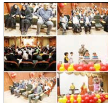
آینده‌سازان کشور شد.

مدیر خانه قرآن «مهراندیشه» همچنین از هم‌خوانی غزلی از لسان‌الغیب حافظ شیرازی، توسط دختران زیر ۷ سال در این مراسم خبر داد و گفت: هدف این بود به جای اینکه کودکان شعرهای کم‌محتوای مرسوم را حفظ کنند، در کنار حفظ آن‌ها، اشعار فاخر ادبیات پارسی را بیاموزند. اینکه دختران کوچک به زیبایی اشعار حافظ را فرارفتند نشان از هوش سرشار نسل امروز و مسئولیت ما در قبال آنان دارد. در ادامه با بیان اینکه آینده کشور در دست همین کودکان است، خاطر نشان کرد: کار فرهنگی روی کودکان بیشتر اثر را روی آینده جامعه خواهد داشت؛ چرا که قلب کودک آماده پذیرش انواع گفتار، رفتار و کردار است. پیامبر اکرم (ص) نیز در این زمینه فرمودند: حکایت کسی که در کودکی می‌آموزد، همچون نقشی است که روی سنگ کنده می‌شود. بنابراین، کار تربیتی و آموزشی