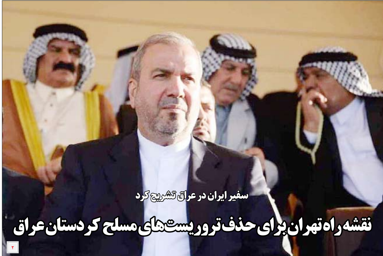
سفیر ایران در عراق تشریح کرد