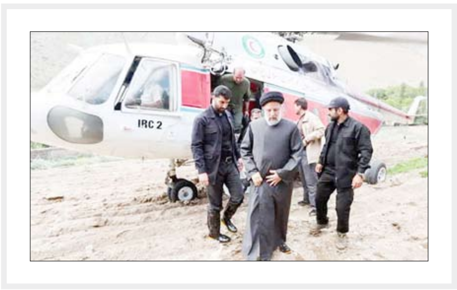
بالگرد حامل رئیس‌جمهور و همراهان در فرودگاه مهرآباد تهران.

به دعا برخاسته‌اند، سید مظلوم و عزیز را به این ملک بازگردان. محمد باقر قلی‌بابا رییس‌مجلس شورای اسلامی نیز از جمله شخصیت‌هایی بود که از مردم خواست که برای سلامتی رییس‌جمهور و همراهان ایشان دعا کنند. حسن روحانی در حساب کاربری خود در شبکه اجتماعی ایکس نوشت: در شب میلاد امام هشتمه، از درگاه پروردگار متعال برای رئیس‌جمهور محترم و همراهانشان، سلامتی آرزومندم و صمیمانه امید دارم ایشان هر چه زودتر به اغوش ملت بازگردند. عزت‌الله ضرغامی، عضو کابینه دولت و وزیر میراث فرهنگی، گردشگری و صنایع دستی در تازه‌ترین مطلبی که در شبکه ایکس (توییتر) منتشر کرد، نوشت: «جلسه امروز هیئت دولت رأس ساعت مقرر تشکیل شد