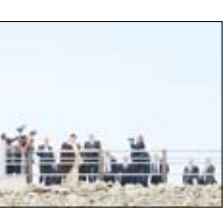
افتتاح رسمی سد قیز قلمه‌سی در آذربایجان.

در اعتقادات و باورهای دو ملت دارد. تاریخ و تمدن و پیشینه ما به هم پیوند دارد. این رابطه قلبی بین دو کشور بوده‌و تا کسنتی است. روز به روز این روابط افزایش خواهد یافت. رئیس‌جمهور در ادامه با بیان اینکه امروز دستوردهی پشرفت‌های مهندسان و متخصصان ایرانی از جمهوری اسلامی ایران کنسورسی فن‌آور و پیشرفته ساخته است، نسبت به انتقال و اشتراک‌گذاری این پیشرفت‌ها با جمهوری آذربایجان اعلام آمادگی کرد و افزود: این سد که نمونه همکاری مشترک میان دو کشور و نماد توانایی مهندسان ایرانی است که ما را جزو ۴ کشور بزرگ دارای علم و فن‌آوری سدسازی در دنیا قرار داده‌و زمینه‌ای برای توسعه همکاری میان جمهوری اسلامی ایران و آذربایجان است و ما برای صدور خدمات مهندسی به جمهوری آذربایجان برای آبادانی این منطقه آمادگی داریم. رئیس‌با اشاره به اینکه آمادگی صدور خدمات فنی و مهندسی به آذربایجان و سایر کشورها را داریم، گفت: باید به جمهوری آذربایجان تبریک بگوییم که منطقه قره‌باغ را در اختیار گرفتند. ما به تمامیت ارضی آذربایجان اعتقاد داریم و شاید از اولین کشورهایی بودیم که صریح اعلام کردیم این منطقه به آذربایجان تعلق دارد. ما برای آبادانی این منطقه آمادگی داریم و همچنین گفت: کریدور ارس باید با ابراه‌ایران و آذربایجان ادامه یابد. من به وزیر راه و شهرسازی برای تکمیل این طرح تأکید کردم. این کار در شش جبهه با قوت در حال انجام است و باید تلاش کنیم تا زودتر از زمان مقرر ۳۶ ماهه، این طرح را به بهره‌براری برسانیم. این جاده‌ای مهم در منطقه است و برای دو کشور اهمیت دارد. رئیس‌جمهور خاطر نشان کرد: سه‌ساله فلسطین سه‌ساله اول جهان اسلام است و تردید نداریم دو