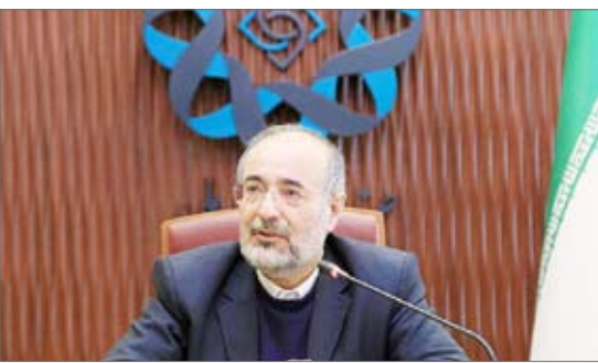
دادگاه تشکیل ندهید، دانشگاه بسازید

حاشیه: پرداختن به امور شخصی و خانوادگی افراد برای تخریب رقیب و فرهنگ جامعه؛ رفتاری بی‌فایده برای کل جمعیت ایران عزیز.