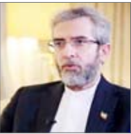
سرپرست وزارت امور خارجه ایران در دیدار خارجه امارات با اشاره به نگاه راهبردی آیت‌الله ریسی به سیاست خارجی، سیاست همسایگی راویکرد هوشمندانه رئیس‌جمهور شهید دانست و بر استمرار آن تأکید کرد. «عبدالله بن‌زاید آل نهمان» وزیر امور خارجه امارات عربی متحده ضمن حضور در آئین بزرگداشت بین‌المللی رئیس‌جمهور و وزیر امور خارجه شهید ایران و ادای احترام به پیکر مطهر آیت‌الله رئیسی رئیس‌جمهور شهید و حسین امیرعبداللهیان وزیر امور خارجه شهید و قرأت فاتحه، با «علی باقری» سرپرست وزارت امور خارجه ایران دیدار و گفت‌وگو کرد. وزیر امور خارجه امارات با ابلاغ پیام‌های تسلیت و همدردی «محمد بن زاید آل نهمان» رئیس و «محمد بن راشد آل مکتوم» معاون رئیس و نخست‌وزیر این کشور به مقامات عالی رتبه، دولت و مردم ایران، و سفرش به ایران در این شرایط سخت را برای ابراز عمق دوستی و همبستگی و تأکید بر روابط برادرانه بین ۲ کشور و ملت دانست. باقری نیز در این دیدار از پیام‌ها و اظهارات محبت آمیز مقامات عالی‌رتبه امارات تشکر و تأکید کرد همدلی و همراهی در بزنگاه‌های سخت، سرمایه ارزشمندی برای همکاری به منظور بهره‌برداری مشترک از فرصت‌ها و مقابله هماهنگ با تهدیدها و چالش‌هایی است که صلح، ثبات و امنیت منطقه را تهدید می‌کند.