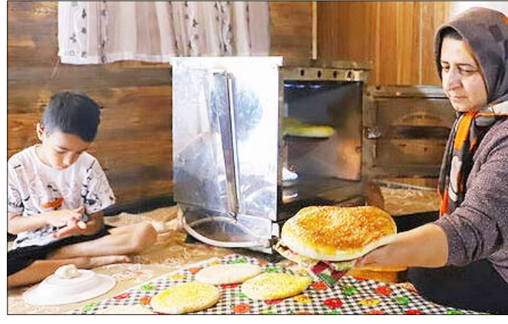
قاب روز - بهشت نگارستان ایران - گرگان - مهر

به روش مبتنی بر هوش مصنوعی در ترکیب با تصویربرداری گرمایی ابداع شده که قادر به ردیابی وضعیت سلامت فرد و سرعت پیری فرد با توجه به تحلیل الگوهای دمای صورت است. به گزارش مهر به نقل از اینترستینگ انجینئرینگ، این فناوری به ردیابی اولیه و تشخیص بیماری‌های مختلف و همچنین مشکلات پزشکی منجر می‌شود. در نتیجه افراد می‌توانند به سرعت در مان دریافت کنند. تحقیق مذکور در دانشگاه یکن چین انجام شده است. محققان در بیانیه مربوط به آن نوشته‌اند: «بخ کردن بینی و گرم شدن گونه‌ها نشانه‌های آشکار افزایش فشار خون هستند. آنها از هوش مصنوعی برای مطالعه ارتباط بین الگوهای دما در بخش‌های مختلف صورت و بیماری‌های مزمن مانند دیابت و فشار خون بالا استفاده کردند. به گفته پژوهشگران الگوهای مبتنی بر هوش