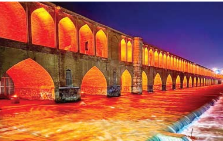
قاپ روز زاینده رود - تسنیم

در ۲۸ مهر ۱۴۰۲ محقق شد. طبق آزمون استخدامی ۲۸ مهر ۱۴۰۲، از مجموع ۲۵ هزار و ۱۲۰ نفر مجوز استخدامی ۸ هزار و ۵۰۰ نفر مجوز بهداشت، حدود سه هزار و ۵۰۰ نفر در حوزه فوریت‌های پزشکی و اورژانس و بیش از ۱۴ هزار و ۵۰۰ نفر نیز در حوزه درمان و پرستاری جذب شدند. اما، آنچه مسلم است اینکه سهم بزرگ‌تری از آزمون استخدامی سال گذشته، کمتر از ۹ هزار نفر بوده است. در حالی که با کمبود حداقل ۱۰ هزار نیروی پرستاری در کشور مواجه هستیم.