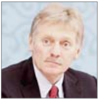
سرگئی لاورننتو، وزیر امور خارجه روسیه، در جریان سخنرانی در مسکو.

سخنگوی کرملین با اشاره به ابراز نگرانی رافائل گروسی مدیر کل اژانس بین‌المللی انرژی اتمی درباره ایمنی نیروگاه هسته‌ای کورسک پس از حملات پهپادی گفت: او کراین مسئول تشدید خطر هسته‌ای در این منطقه است؛ هر چند اژانس اتمی به دلایل واضح، نمی‌تواند رسماً این موضوع را اعلام کند. دیمیتری پسکوف چهارشنبه در نشست خبری افزود: گروسی در بازدید از نیروگاه اتمی کورسک، نتایج حملات پهپادهای او کراین به این نیروگاه را از نزدیک دید و متوجه تهدیدی که این حملات می‌تواند ایجاد کند و تهدید بالقوه‌ای که ادامه دارد، شد. سخنگوی دفتر ریاست جمهوری روسیه خاطر نشان کرد: اژانس بین‌المللی انرژی اتمی به دلایل مشخصی از نبود اختیار برای اعلام مسئولیت این حملات سخن می‌گوید، اما در اینجا همه چیز آنقدر واضح است که هیچ سوآلی وجود ندارد؛ تشدید خطر هسته‌ای بیش از پیش آشکار است. رافائل گروسی مدیر کل اژانس بین‌المللی انرژی اتمی که روز سه‌شنبه از نیروگاه هسته‌ای کورسک بازدید کرد، گفت که در این بازدید آثاری از حملات پهپادها را دیده است. وی با بیان اینکه کارکنان این نیروگاه در حالت "تزدیک به حالت عادی" به فعالیت خود ادامه می‌دهند، در عین حال نسبت به ایمنی این نیروگاه هسته‌ای ابراز نگرانی کرد.