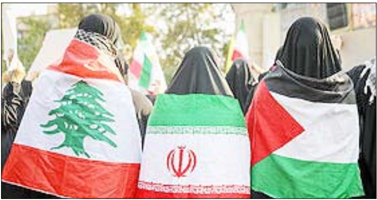
اجتماع مردمی دفاع از جبهه مقاومت

آیین نامه اخلاق حرفه‌ای «تجارت» را در سایت روزنامه ببینید.