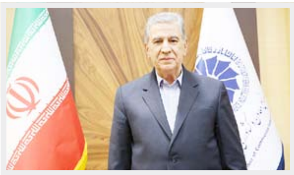
دلیل تحریم ها، شرایط سختی برای اقتصاد کشور فراهم شد و محدودیت ها سبب