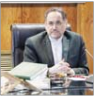
رئیس مرکز پژوهش‌های مجلس در تشریح نقاط قوت و ضعف لایحه بودجه

رییس مرکز پژوهش‌های مجلس در تشریح نقاط قوت و ضعف لایحه بودجه ۱۴۰۴، گفت: این لایحه نسبت به قوانین بودجه سال‌های پیش از جهات مهمی مانند یکپارچگی و واقعی بودن منابع و مصارف و همچنین توجه به تعهدات و پدھی‌های دولت، پیشرفت کرده اما در زمینه پرداختن به برخی چالش‌ها مانند تمهید منابع مالی برای رشد پایین‌تر از تورم حقوق کارمندان دولت و درج احکام غیربودجه‌ای ذیل لایحه بودجه، توفیق چندانی نداشته‌است. وی افزود: از سوی دیگر، سیاست‌های کلی اقتصادی مقاومتی هم به راهبرد اصلاح نظام درآمدی دولت با افزایش سهم درآمدهای مالیاتی و همچنین افزایش سالانه سهم صندوق توسعه ملی از منابع حاصل از صادرات نفت و گاز تا قطع وابستگی بودجه به نفت اشاره دارد. رییس مرکز پژوهش‌های مجلس در تشریح نقاط قوت و ضعف بودجه سال ۱۴۰۴ عنوان کرد: در بحث واقعی کردن منابع و مدیریت مصارف دولت، باید گفت لایحه بودجه ۱۴۰۴ یک جهش نسبت به لویح بودجه پیش از خود محسوب می‌شود؛ از این جهت که برای نخستین بار، تمام منابع و مصارف فرابودجه‌ای دولت از قبیل هدفمندسازی یارانه‌ها یا نفت مربوط به نیروهای مسلح در سقف منابع و مصارف بودجه لحاظ شده و مخاطب می‌تواند یک تصویر دقیق از حجم گردش مالی دولت در سال مالی داشته باشد. این مسئله طبیعتاً انضباط مالی بالاتر و شفافیت را نیز به دنبال خود خواهد داشت.