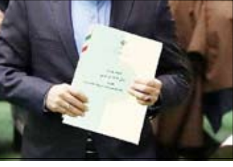
زارع در ادرین جلسه برآوردی از وضعیت شاخص‌های کلان اقتصادی همچون نرخ تورم، رشد اقتصادی، رشد نقدینگی، ضریب جینی، وضعیت سرمایه‌گذاری و کاهش محرومیت‌زدا یی و همچنین حجم صادرات غیر نفتی و واردات مورد بررسی قرار گرفت.

در این خصوص مرتضی افقه، اقتصاددان می‌گوید: کاهش تنش‌ها، قیمت ارز و طلا را تحت تأثیر قرار داده و سیاست‌های فعلا نه بانک مرکزی به کنترل بازارها کمک می‌کند. افقه، به تأثیر واکنش‌حمله اسرائیل بر بازار ارز پرداخت و اظهار کرد: مدت‌هاست که در تمامی نوشته‌ها یم تأکید کرده‌ام که قیمت دلار و تتر، عمدتاً تابع تحولات بیرونی و تنش‌های منطقه‌ای است. وی افزود: انتظار می‌رفت که اسرائیل به ایران پاسخی دهد و متأسفانه برخی رسانه‌های خارجی هم سعی داشتند تا فضا را ملتهب کنند. اما با این حمله مشخص شد که اسرائیل واکنش گسترده‌ای نشان نخواهد داد؛ اگرچه پیش‌تر اعلام کرده بود که پاسخی شدید خواهد داشت، اما شاهد یک حمله